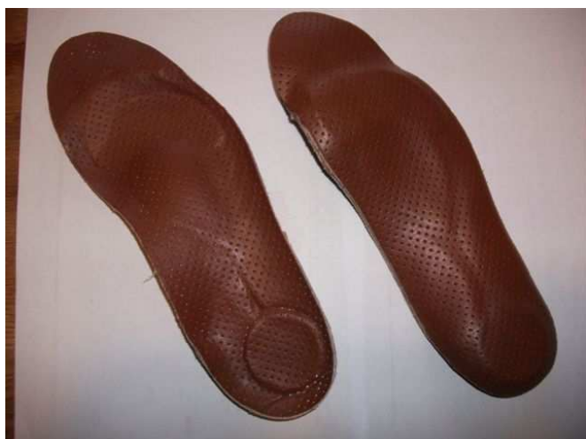
Pour la marche

J'ai aujourd'hui effectué près de 300km de marche avec et je dois dire ma satisfaction totale dans le travail réalisé par Mr SEMPE. Pour ce qui est de celle dédié aux chaussures de vélo, je n'ai pas assez de recul (moins de 50 h) je vous en parlerais dans un futur pas trop éloigné.