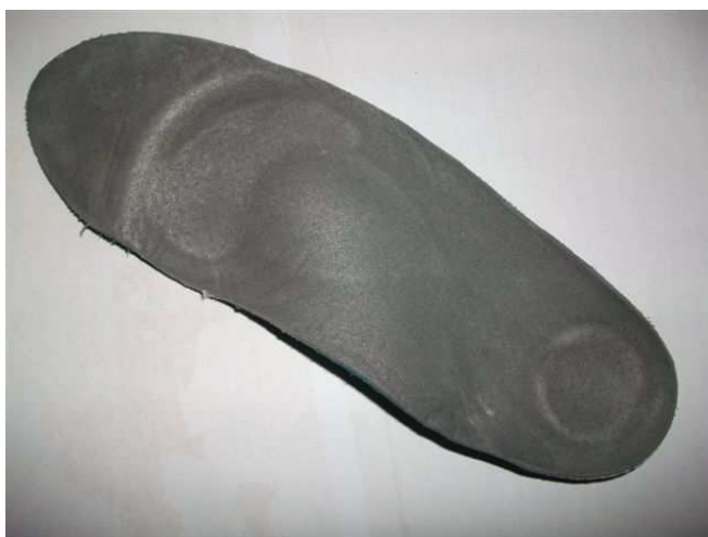
pour le vélo